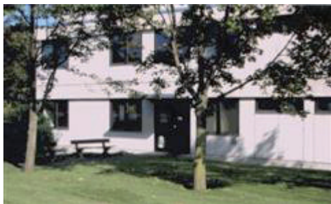
Eingang Gebäude Nr. 90

Das Gebäude Nr. 90, in dem auch die Siemens active-Sportgruppe (SAM) untergebracht ist, liegt ca. 50 m südlich des Eingangs Süd des Siemens-Werkgeländes und hat einen eigenen Zugang.